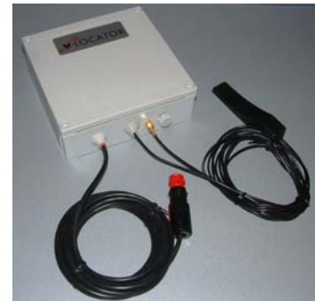
Mobil-Box zum Anschluss an den Zigarettenanzünder